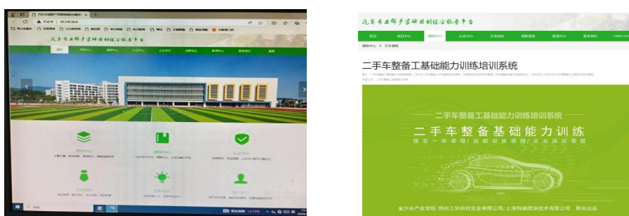
图1 汽车后市场服务“产、学、研、用、创”综合服务平台

校企合作共同打造了一个集产业对接、学术研究、技术研发、应用实践和创新创业于一体的综合服务平台。学校提供教学资源和研究能力，汽车后市场产业链企业则提供市场经验和技术支持。这一平台不仅促进了校企之间的紧密合作，还为学生提供了实践学习和创新创业的机会。