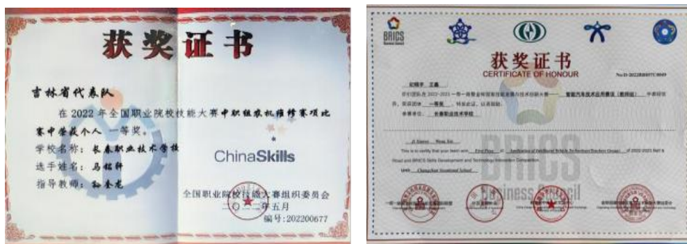
图3 师生荣获多项国家级技能大赛一等奖

通过校企合作的实践教学和职业培训，学生的专业技能和综合素质得到了显著提高。多名学生在省级以上技能大赛中获奖，证明了这种培养模式的实效性。同时，学生的就业率也大幅提升，受到用人单位的广泛好评。