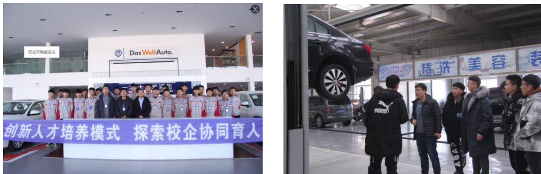
图4 通过“产学研用创”平台组织师生进行线下实践活动

通过深度的校企合作，学校能够更准确地把握市场动态和行业需求，从而调整教学内容和方式，培养出更符合市场需求的高素质人才。这种产教融合的模式，对于提高职业教育的质量和效果，以及推动行业发展和技术进步都具有重要意义。