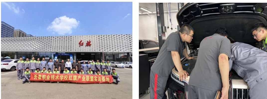
图5 我校学生到红旗4S店进行校外企业实践

产教融合的模式有助于推动行业发展和人才培养形成良性循环。学校通过实践教学和职业培训，培养出具备专业技能和创新能力的人才，这些人才进入企业后，能够迅速适应市场需求，推动行业的技术进步和创新。同时，企业的发展也会反哺学校，为学校提供更多的教学资源 and 实践机会，进一步提升人才培养质量。